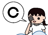
4月視力検査の結果